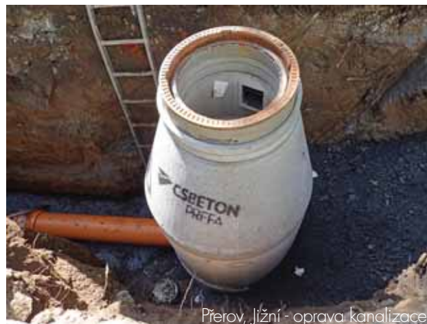
Přerov, Jižní - oprava kanalizace