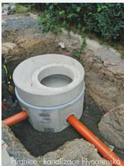
Hranice - kanalizace Plynářská