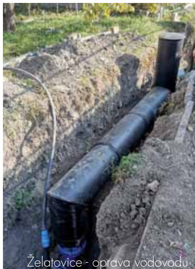
Želatovice - oprava vodovodu