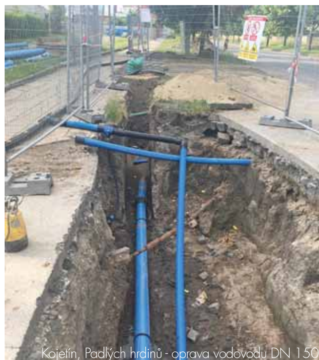
Kojetín, Padlých hrdinů - oprava vodovodu DN 150