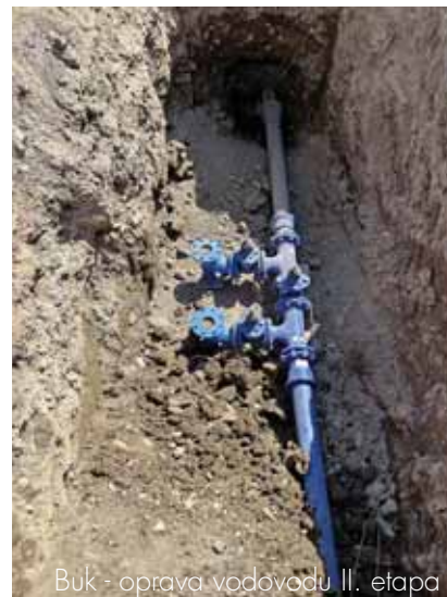
Buk - oprava vodovodu II. etapa