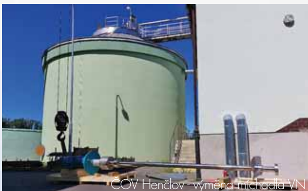
ČOV Henčlov - výměna míchadla VN