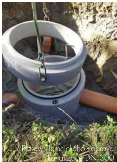
Přerov, Jilemnického - oprava kanalizace DN 300