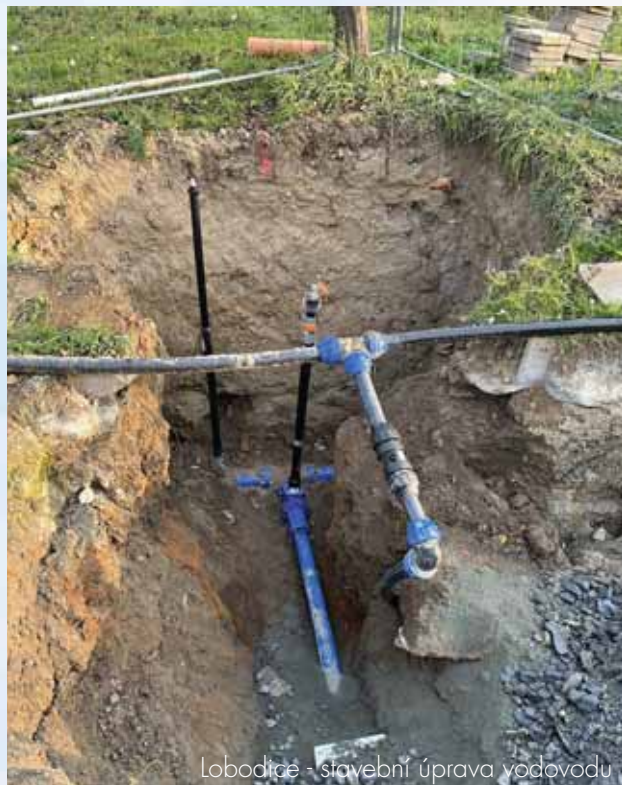
Lobodice - stavební úprava vodovodu