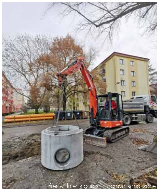
Přerov, Interbrigadistů - oprava kanalizace