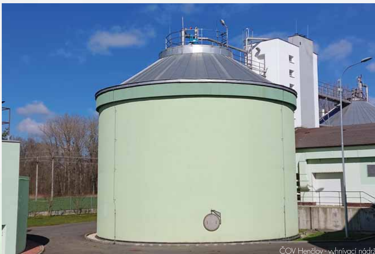
ČOV Henčlov - vyhnívací nádrž