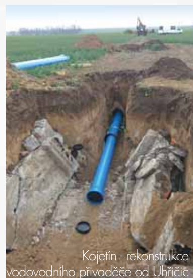
Kojetín - rekonstrukce vodovodního přivaděče od Uhřetíc