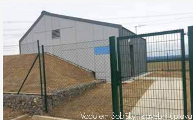
Vodojem Sobišky - stavební úprava