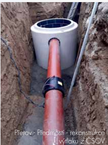
Prerov - Předmostí - rekonstrukce výtlaku z ČSOV