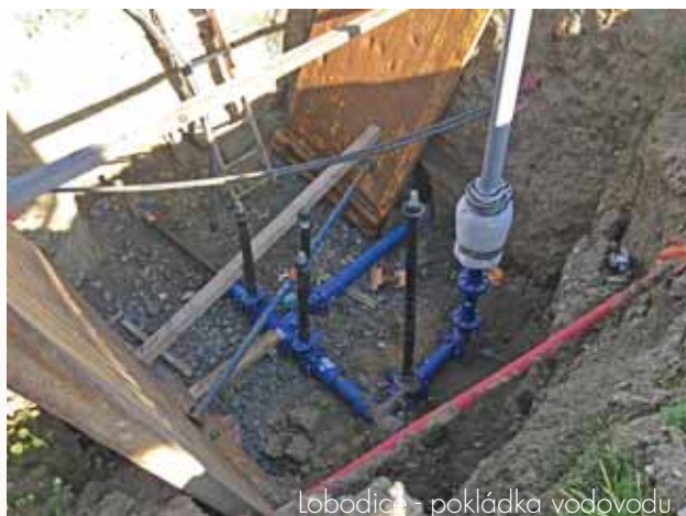
Lobodice - pokládka vodovodu