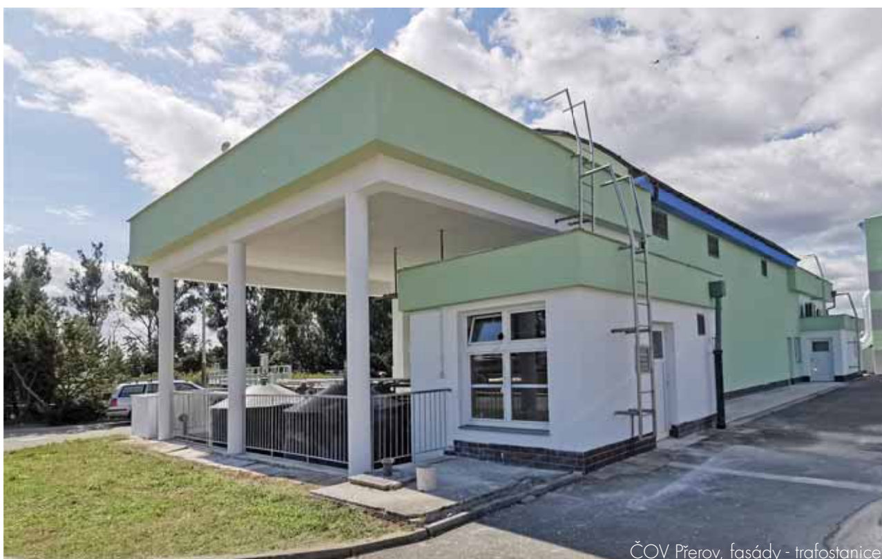
ČOV Přerov, fasády - trafostanice