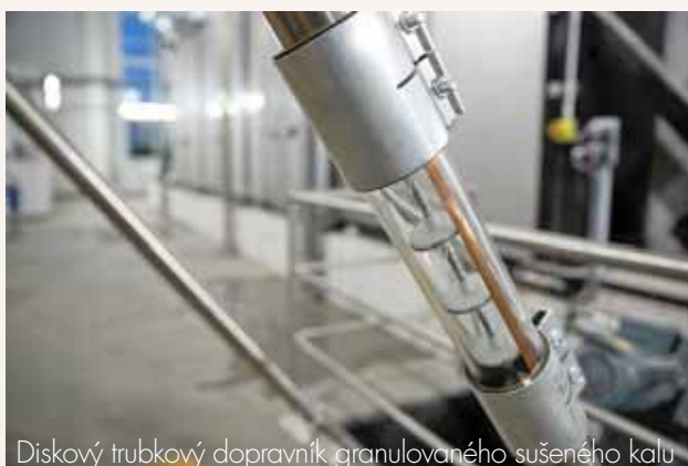
Diskový trubkový dopravník granulovaného sušeného kalu