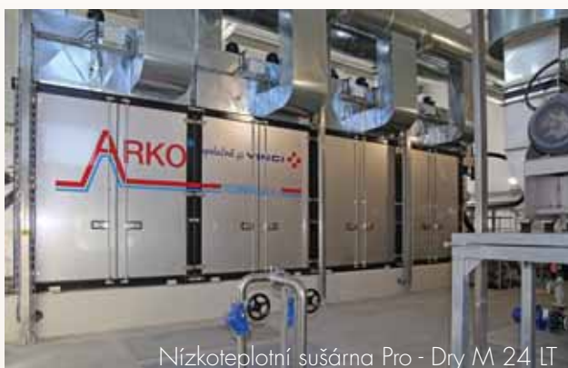
Nízkoteplotní sušárna Pro - Dry M 24 LT