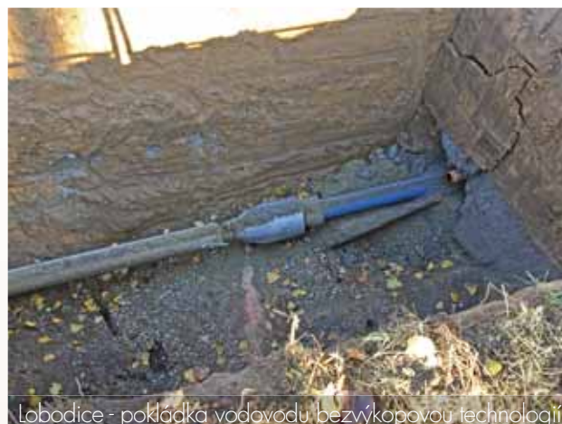
Lobodice - pokládka vodovodu bezvýkopovou technologií