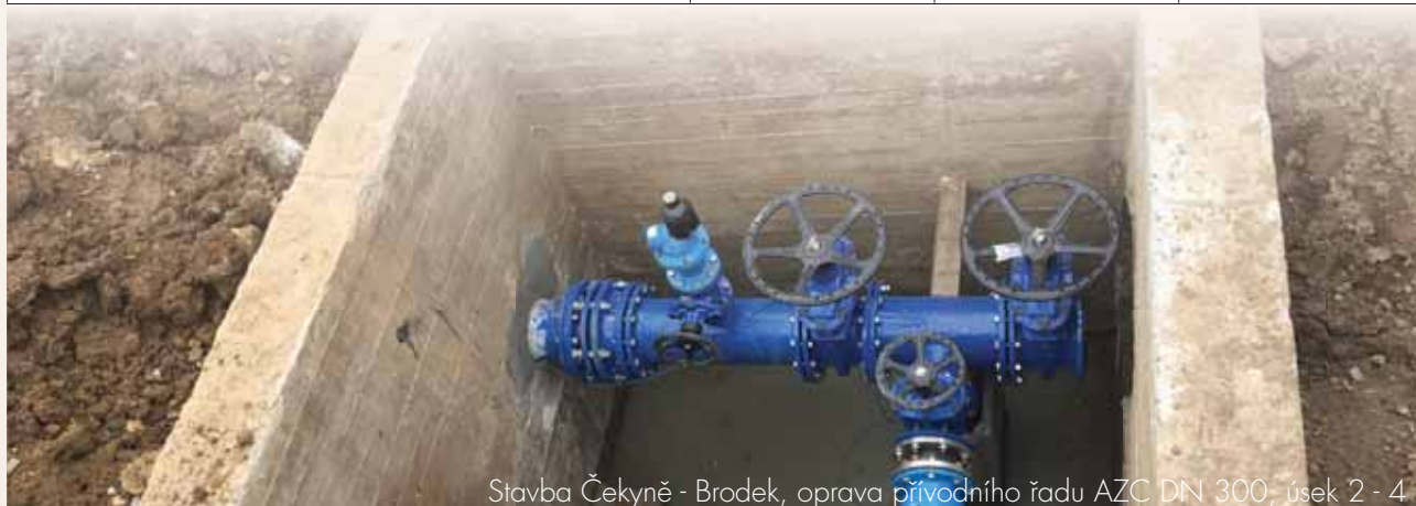
Stavba Čekyně - Brodek, oprava přívodního řadu AZC DN 300, úsek 2 - 4