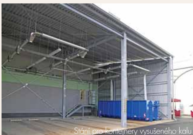
Stání pro kontejnery vysušeného kalu