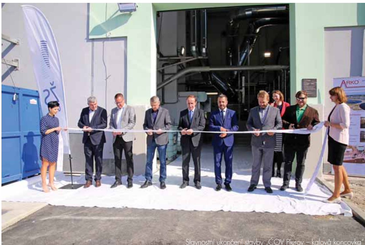
Slavnostní ukončení stavby „ČOV Přerov – kalová koncovka“