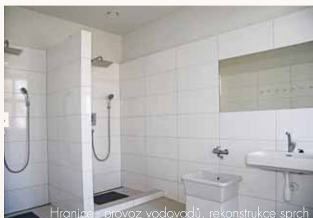
Hranice - provoz vodovodů, rekonstrukce sprch