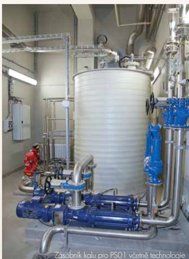
Zásobník kalu pro PS01 včetně technologie