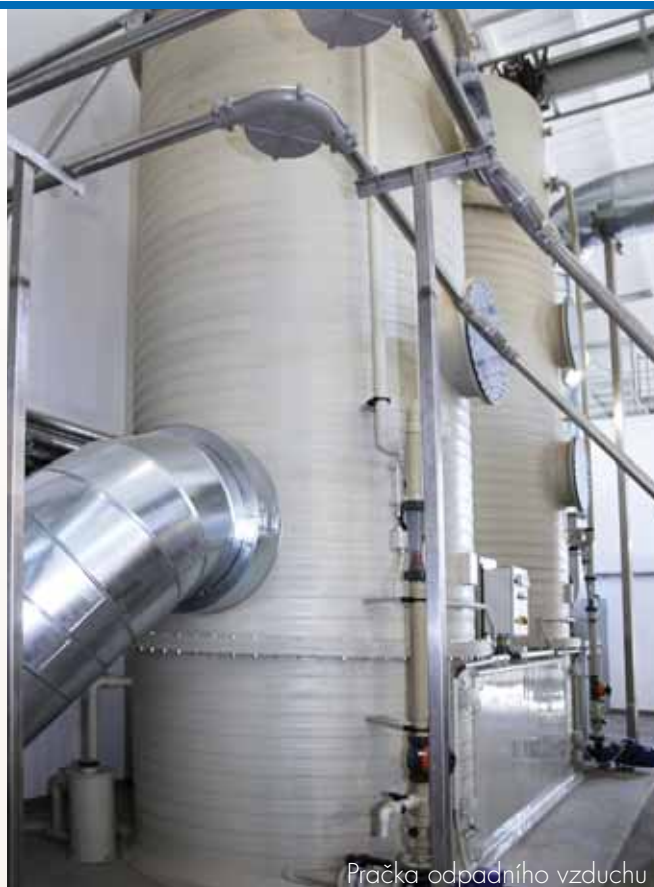
Pračka odpadního vzduchu