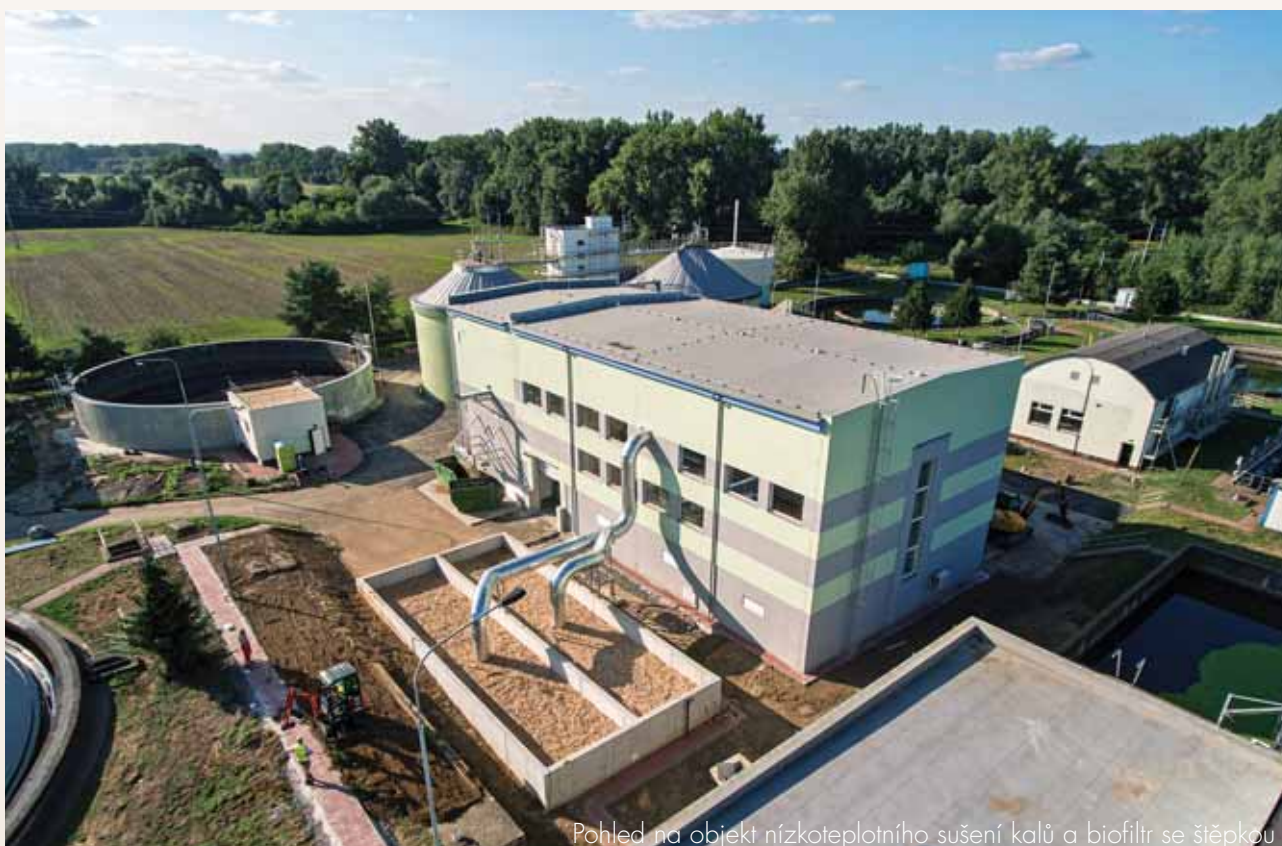
Pohled na objekt nízkoteplotního sušení kalů a biofiltr se šišpkou