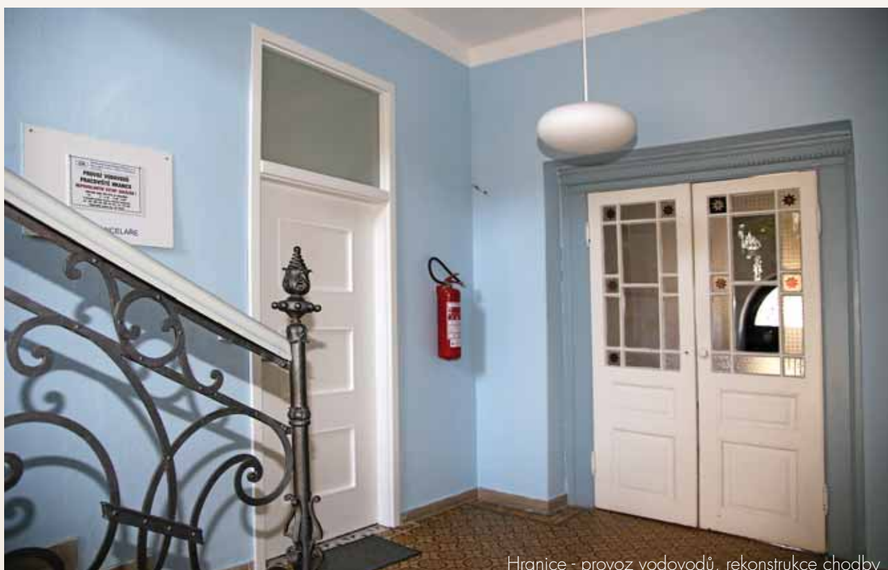
Hranice - provoz vodovodů, rekonstrukce chodby