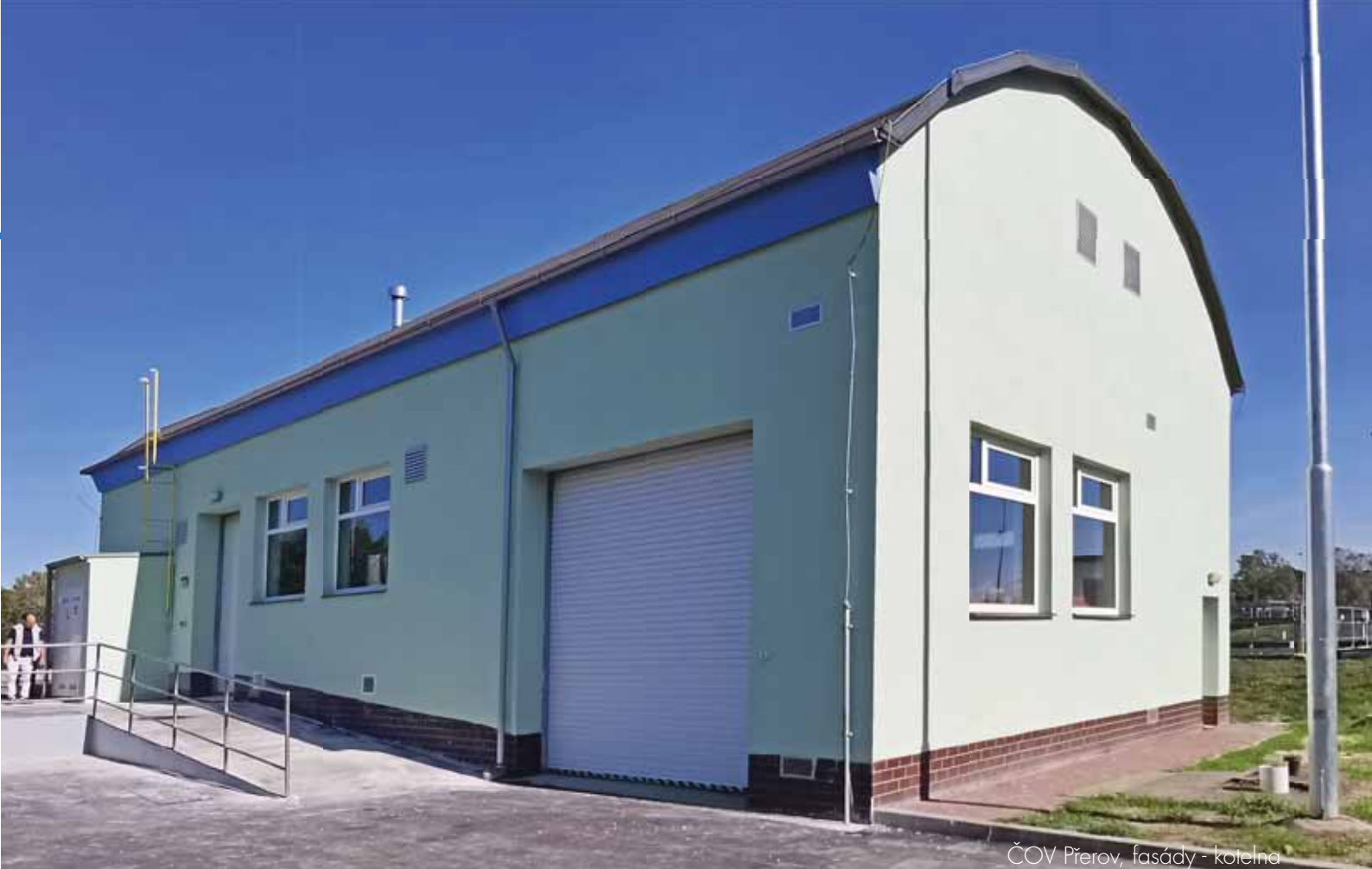
ČOV Přerov, fasády - kotelna