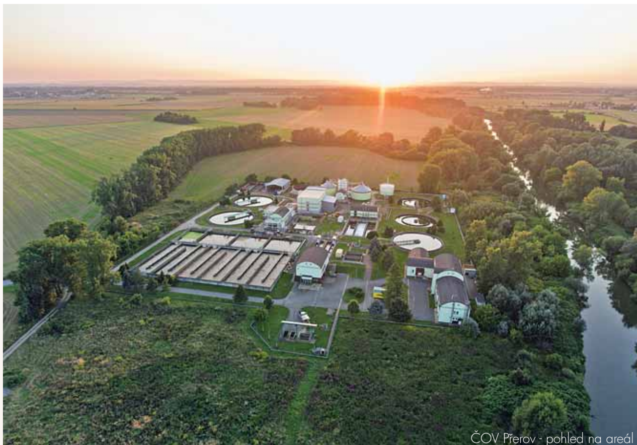
ČOV Přerov - pohled na areál