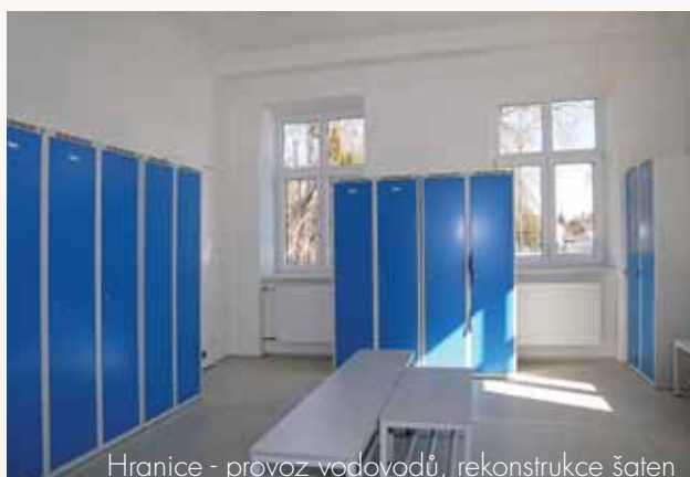
Hranice - provoz vodovodů, rekonstrukce šaten