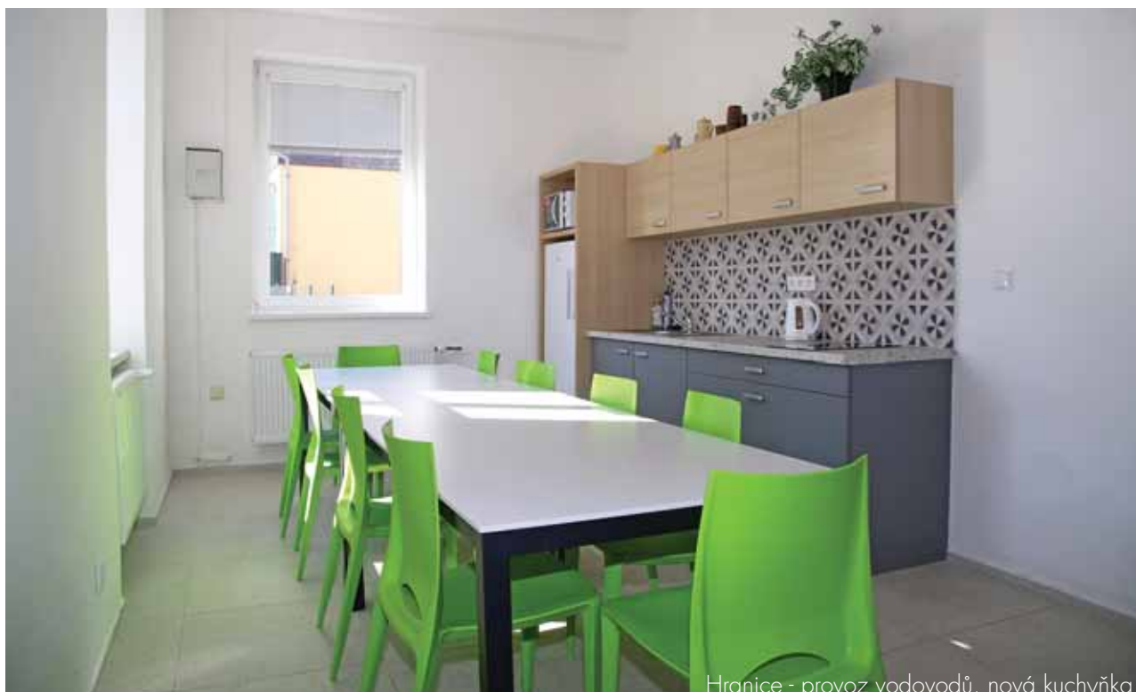
Hranice - provoz vodovodů, nová kuchyňka

I přes značnou péči věnovanou oblasti BOZP došlo k 2 pracovním úrazům s celkovou délkou pracovní neschopnosti 39 pracovních dnů. V roce 2021 nebyl zaznamenán žádný pracovní úraz bez pracovní neschopnosti.