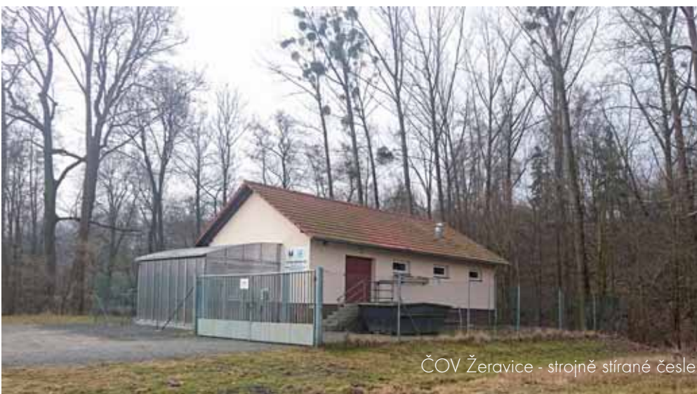
ČOV Žeravice - strojně stírané česle