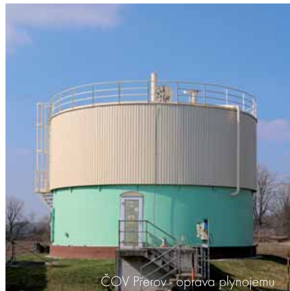
ČOV Přerov - oprava plynojemu