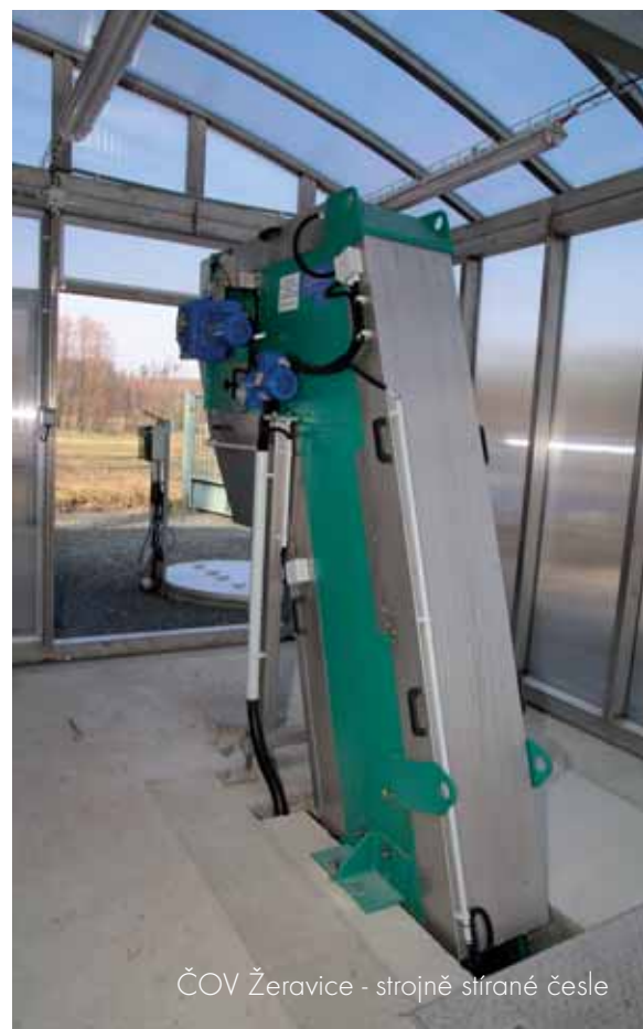
ČOV Žeravice - strojně stírané česle