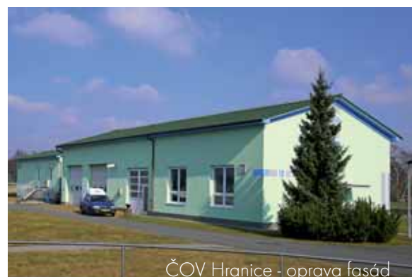
ČOV Hranice - oprava fasád