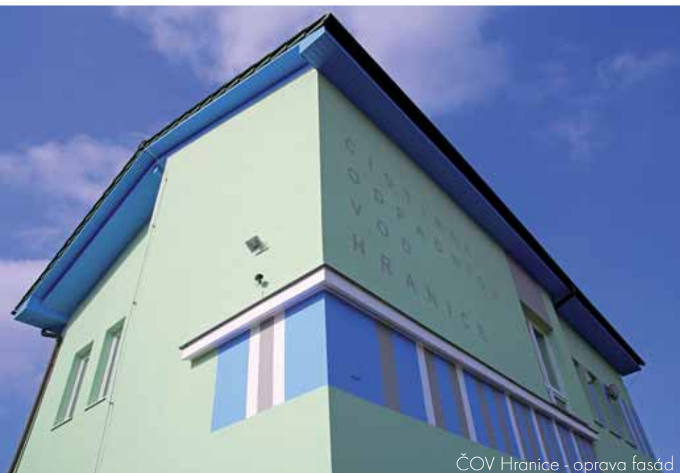
ČOV Hranice - oprava fasád