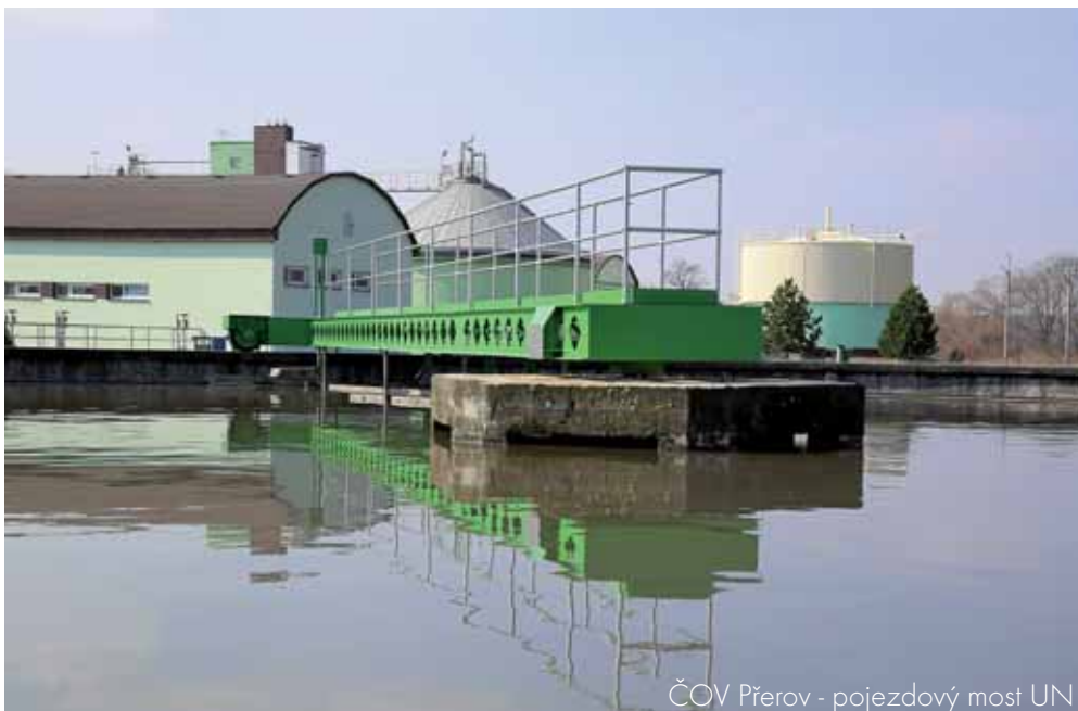
ČOV Přerov - pojezdový most UN