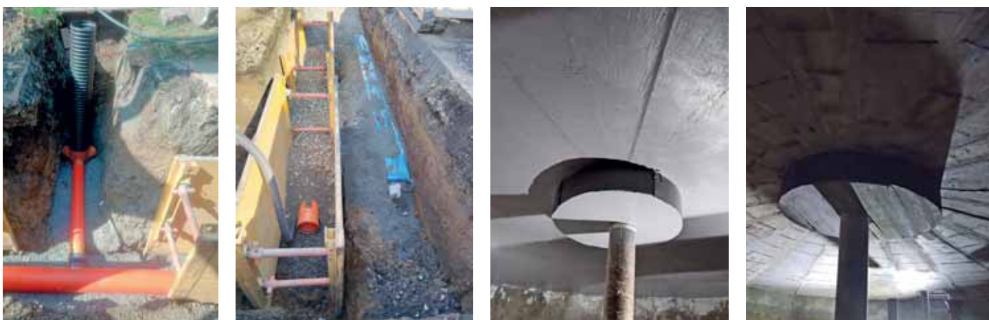
Předmostí - Dluhonice, oprava přívodního řadu