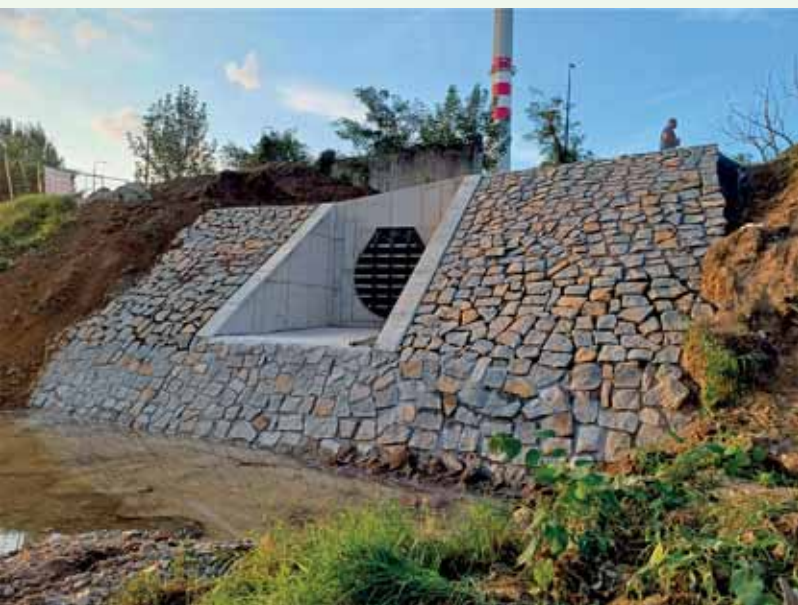
Přerov, odlehčovací stoka z OK1N - rekonstrukce výustního objektu