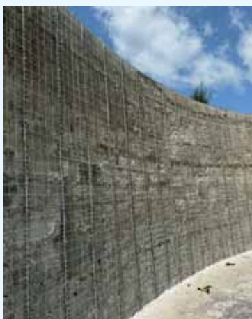
ČOV Přerov - stavební oprava uskladňovací nádrže