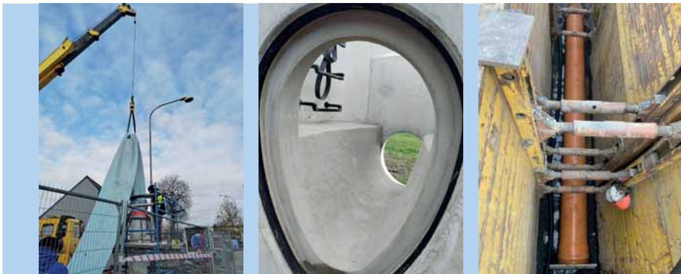
Kojetín - oprava vodovodu a kanalizace v ul. Sadová