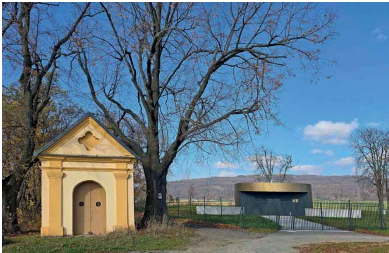
Vodojem Svatá Anna