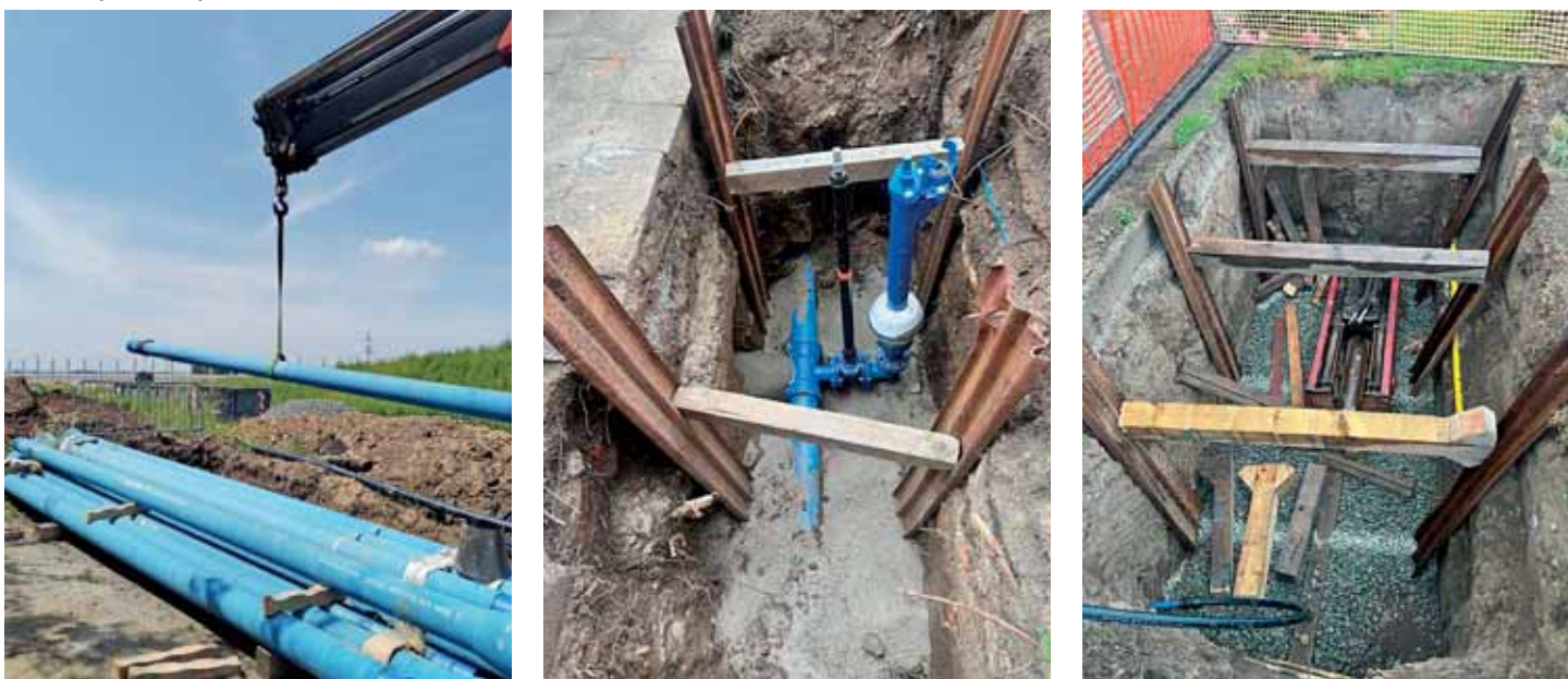
Tovačov - oprava vodovodních řadů